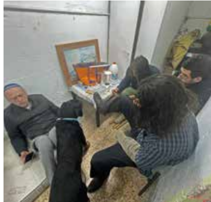
Wer keinen Schutzraum im Gebäude hat, ist auf die öffentlichen Bunker angewiesen. Dort treffen sich Menschen, die sich sonst höchstens vom Sehen auf der Straße kennen.