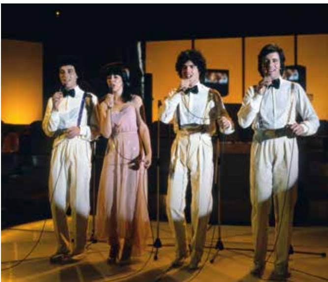
Die Band „Milk & Honey“ mit Sängerin Gali Atari gewann den ESC 1979; hier ein Bild von einem Auftritt in Deutschland in den 1970er Jahren

Antreten wird im Mai übrigens nach mehreren Jahren wieder ein Mann für Israel: Noam Bettan. An seinem Song „Michelle“ hat eine alte Bekannte mitgeschrieben: Juval Raphael. „Als jemand, der dort war, verstehe ich, wie sehr der ESC zu einem weiteren wichtigen internationalen Schauplatz für uns geworden ist, um uns zu zeigen und dort zu sein und das Gute und die Liebe hinzubringen, die in uns stecken“, sagte sie im Vorfeld der 70. ESC-Ausgabe. Wie schon 2025 kommt ihr kein Wort des Schmerzes über die Lippen. Die Proteste, so scheint es, lächelt Israel auch in diesem Jahr gekonnt weg. |