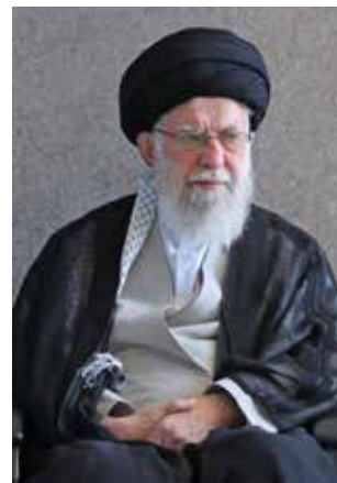
Bild links: Der israelische Premier Netanjahu (l.) und US-Präsident Trump hatten den Obersten Führer des Iran, Chamenei (Bild rechts), schon länger im Visier

destabilisierende Rolle, die Iran in der Region spielt. Sie stecken hinter Anschlagversuchen hier bei uns in Deutschland und in Europa. Kurzum: Sie haben Blut an ihren Händen“.