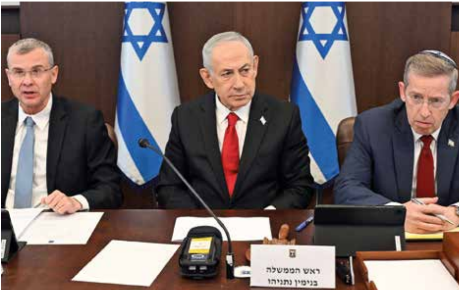
Israels Premierminister Netanjahu auf einer Pressekonferenz nach einer Kabinettsitzung im Februar

Nach allem Versagen und dem Hass auf Israel ist die Frage berechtigt: Gilt die Erwählung der Christen noch? Wer so viel Dreck am Stecken hat wie wir, nicht nur gegenüber Israel, sollte sich bei der Beurteilung des heutigen jüdischen Staates und seiner Regierung zurückhalten. Eines bleibt wie in biblischer Zeit: Ob Israel und dessen Regierungschefs nach Gottes Willen handeln, obliegt allein seinem Urteil. Das gilt auch für die Kirche und deren Verantwortungsträger. |