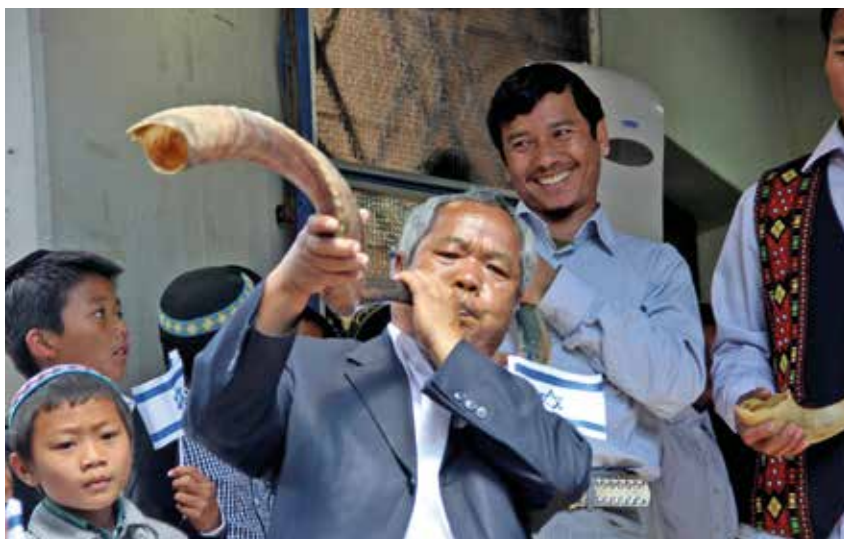
Diese Angehörigen der Bnei Menasche identifizieren sich klar mit dem Judentum und Israel

Die Entwicklung gefällt längst nicht allen Israelis. 2003 sagte der damalige Innenminister Avraham Poras abfällig: „Nur Bewohner der Dritten Welt scheinen interessiert, zu konvertieren und nach Israel einzuwandern.“ Auch die Forsch-