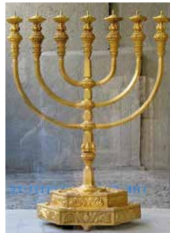
Die Menora besteht aus 24-karätigem Gold

Zu sehen sind die für den Tempeldienst nötigen Utensilien im hauseigenen Museum in der Jerusalemer Altstadt. Darüber hinaus versteht sich das Tempelinstitut als Ausbildungszentrum. Priesternachkommen sollen in den rituellen Abläufen für den Dienst im Tempel geschult werden. Ein dritter Aufgabenbereich ist die Erforschung bestimmter Inhaltsstoffe, die für einige Rituale notwendig, aber heute unbekannt sind. |