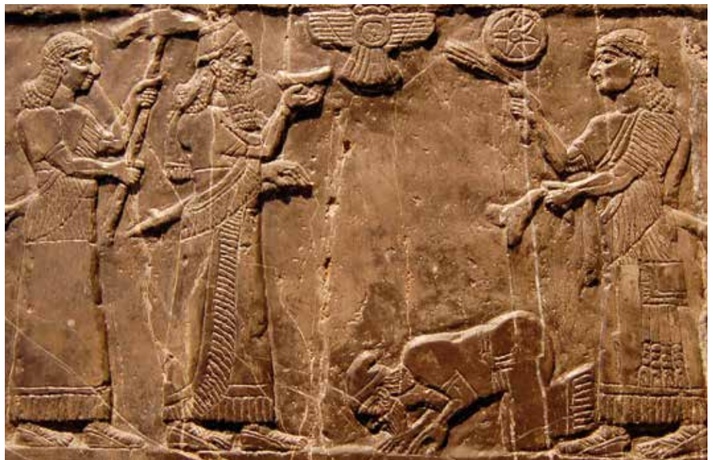
Der „Schwarze Obelisk“ zeigt den israelitischen König Jehu, oder dessen Botschafter, kniend vor dem assyrischen Monarchen Salmanasser III. (etwa 827 v. Chr.)

ger Rehabeam zum Bruch: Rehabeam hielten nur die Stämme Juda und Benjamin die Treue. Die zehn anderen verweigerten ihm die Gefolgschaft und bildeten im 9. Jahrhundert vor Christus das Nordreich Israel. Wegen des intensiven Götzendienstes im Nordreich warnten die Pro-