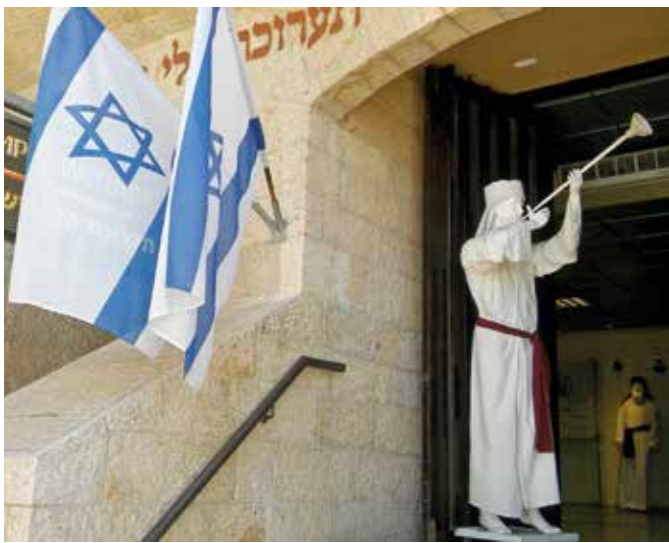
Der Eingang zum Tempelinstitut in Jerusalem

Die Diskussion um den Dritten Tempel ist so alt wie die Zerstörung seines Vorgängerbaus im Jahr 70 nach Christus. Und auch der große jüdische Religionsphilosoph Maimo-