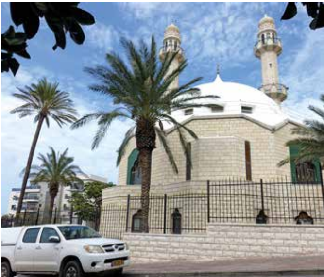
Die Mahmud-Moschee beherrscht mit ihren 34 Meter hohen Minaretten das Bild von Kababir