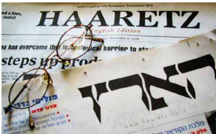
Seit 1997 hat „Ha'aretz“ auch eine englische gedruckte Ausgabe

So ein Vorgang bedarf wohl keines Kommentars. Ob der kritiklose Abdruck solch einer Behauptung zu einer „seriösen“ Zeitung passt, muss der Leser entscheiden. |