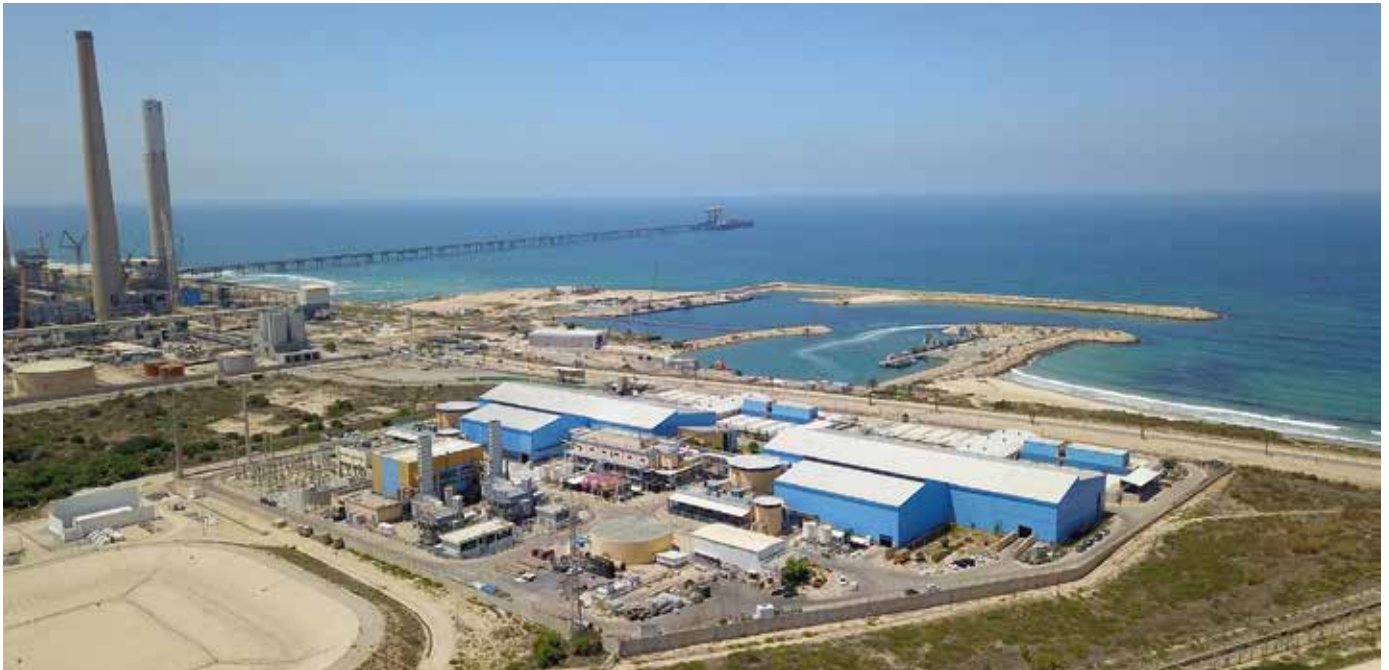
Nicht schön, aber praktisch – und immerhin mit Meerblick: Die Entsalzungsanlage Sorek

Spätestens seit dem Sommer 2018 ist den Deutschen bewusst, wie abhängig das Land von Regen ist: Die Dauerhitze konnten sie am eigenen Leib spüren, Bilder von ausgetrockneten Feldern waren in neuer Regelmäßigkeit zu sehen, ebenso wie Karten, die die Bodentrockenheit in einem alarmierenden Rot anzeigten. Der „Dürresommer“ hat sich vielfältig bemerkbar gemacht. Und Experten sind sich einig: Privatverbraucher, Industrie und Landwirtschaft werden hierzulande immer stärker um das kostbare Nass konkurrieren.