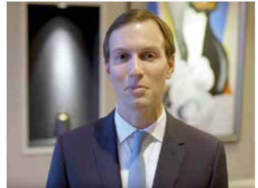
Der 38-jährige Jared Kushner auf dem Gipfel in Manama

Kushner sprach in der bahrainischen Hauptstadt Manama von „einem neuen Kapitel in der palästinensischen Geschichte und der Entfesselung des ganzen Potenzials des palästinensischen Volkes“. Als Vorbild diene ihm, dem US-Sondergesandten für