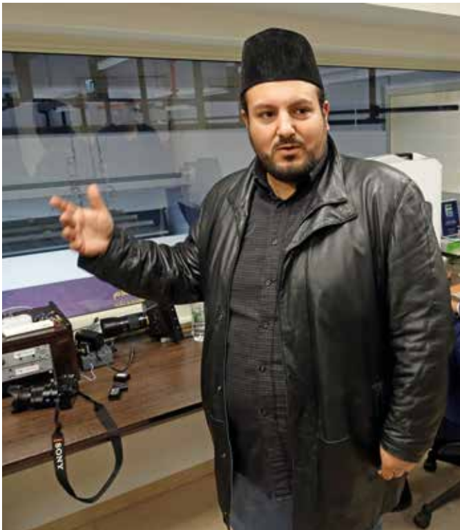
Ajman arbeitet für den Fernsehsender der Ahmadija-Bewegung, die stark missionarisch geprägt ist

K ababir, so heißt der Ortsteil in den westlichen Hügeln des Karmel-Gebirges, im Süden der nordisraelischen Küstenmetropole Haifa. Von hier bietet sich dem Besucher ein malerischer Blick auf die Stadt und das Mittelmeer. Kababir ist nach einer großen Höhle benannt, deren Kalkstein zum Häuserbau verwendet wurde. Es ist der Wohnort einer kleinen Gemeinschaft, der Ahmadija. Weltweit hat diese schätzungsweise zehn Millionen Anhänger. Wie viele von ihnen in Israel leben, ist nicht genau bekannt. Die Zahlen schwanken zwischen 1.000 und 2.200 Mitgliedern.