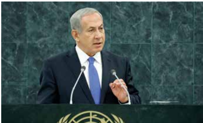
Die Israelis schätzen Netanjahus rhetorisch gut einstudierte Auftritte vor der UNO-Generalversammlung

A m 20. Juli hat der jetzige Premierminister Israels, Benjamin Netanjahu, mit der Länge seiner Amtszeit den Staatsgründer David Ben-Gurion überrundet. Wobei beide das nicht ohne Unterbrechungen geschafft haben.