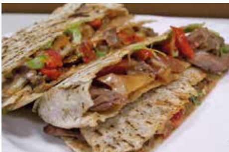
Auch Pita mit Lammfleisch gibt es auf der Speisekarte des Restaurants „Roots“ (Symbolbild)

In der nordisraelischen Hafenstadt Akko gibt es eine neue Attraktion: Dort haben ein Jude, ein Christ und ein Muslim ein gemeinsames Restaurant eröffnet. Was wie der Anfang eines Witzes klingt, ist tatsächlich Ausdruck religiöser Vielfalt unter einem Dach. Das koschere Restaurant heißt „Roots“ und bezieht sich damit auf die Wurzeln der drei Partner.