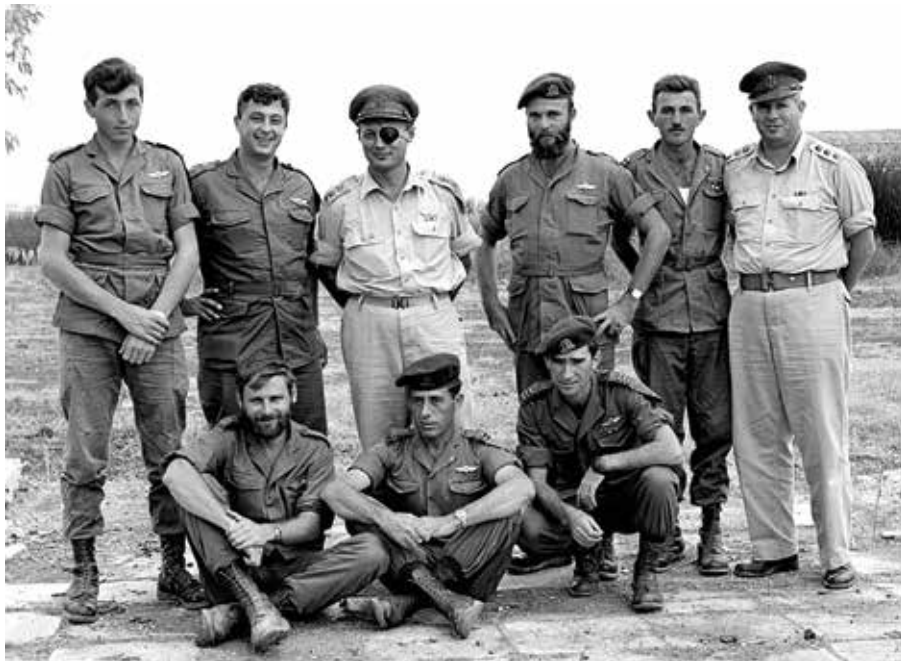
Mitglieder des Bataillons 890, in das die Einheit 101 eingegliedert wurde. Unter ihnen ist Mosche Dajan (3. v.l.), Armee-Generalstabschef und späterer Außenminister.

Die Einheit 101 ist der Prototyp der israelischen Spezialeinheit. Sie führte innovative Offensiv- und Infiltrationstaktiken ein und ist bis heute das Vorbild israelischer Kommando-Operationen.