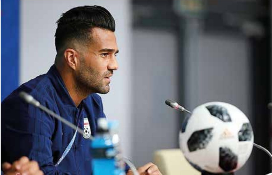
Der iranische Fußballer Masoud Shojaei hätte fast die Fußball-WM in Russland verpasst (Bild links). Der Ägypter Islam El-Shehaby verweigert dem Israeli Or Sasson bei den Olympischen Spielen 2016 den Handschlag.