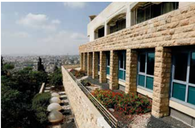
Blumen und Ausblick: Das Lernambiente stimmt

Elon Lindenstrauss Fields-Medaille für Mathematik, 2010