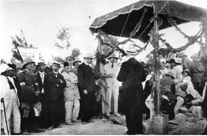
Ein Gedränge: Bei der Grundsteinlegung waren zahlreiche Würdenträger anwesend