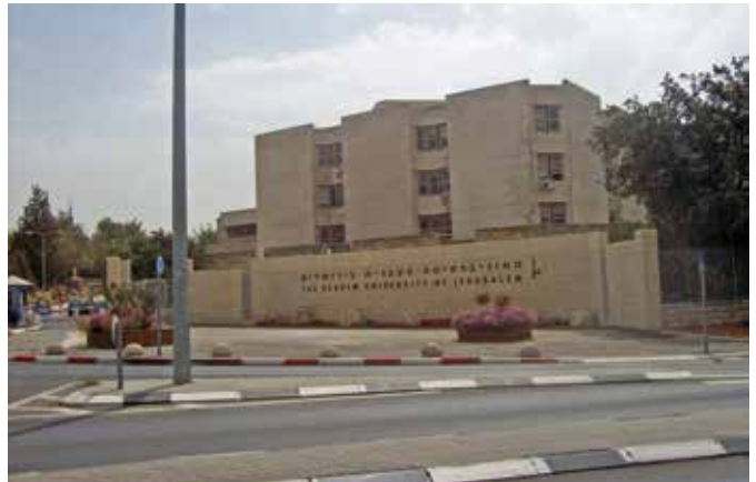
Für Hebräisch- und Englischsprachige: Schriftzug der Hebräischen Universität

Mit ihrer Geschichte und Ausrichtung spiegelt die Hebräische Universität die Aspekte des jüdischen Staates im Kleinen wider: Angefeindet und erfolgreich, anfangs provisorisch und doch selbst- und sendungsbewusst, zuerst für Juden und doch nicht exklusiv. Wie Weizmann es schilderte, sangen die Anwesenden bei der Grundsteinlegung noch die Hatikva, damals das Lied der zionistischen Bewegung, und betrachteten dann noch die Steine schweigend, bis die Nacht eingebrochen war. Für sie, so schreibt es der Historiker Tom Segev, waren es nicht nur die Grundsteine der Universität, sondern die des jüdischen Staates. |