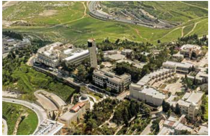
Geradezu ein Erkennungszeichen: Der Universitätsturm auf dem Skopusberg

Einstein tat sich jedoch nicht nur als Physiker hervor, sondern auch als Zionist. Als Akademiker lag ihm dabei das Projekt einer Universität am Herzen. Das Land besuchte er nach dem Aufenthalt von 1923 zwar nicht mehr, doch zeit seines Lebens setzte