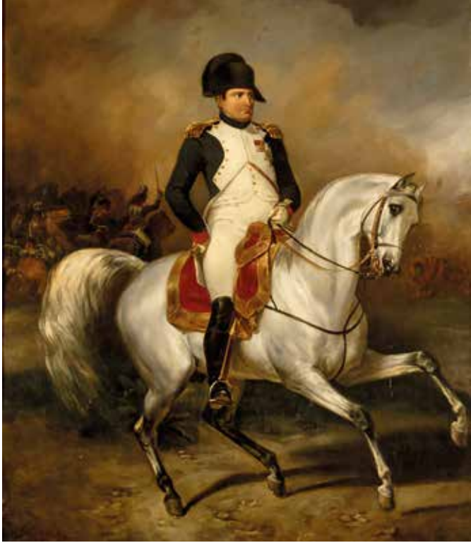
Napoleon zu Pferde – ein Ölgemälde von Simon Meisner aus dem Jahre 1832