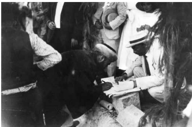
Rabbi Ben-Zion Chai Uziel aus Jaffa, der spätere sephardische Oberrabbiner, unterzeichnet das Gründungsdokument

Mit Blick auf den jüdischen Charakter der Bildungseinrichtung hatte dann auch die erste Vorlesung ihre Symbolik: Am 8. Februar 1923, zwei Jahre vor der eigentlichen Eröffnung der Universität am 1. April 1925, hielt sie kein geringerer als der schwäbisch-jüdische