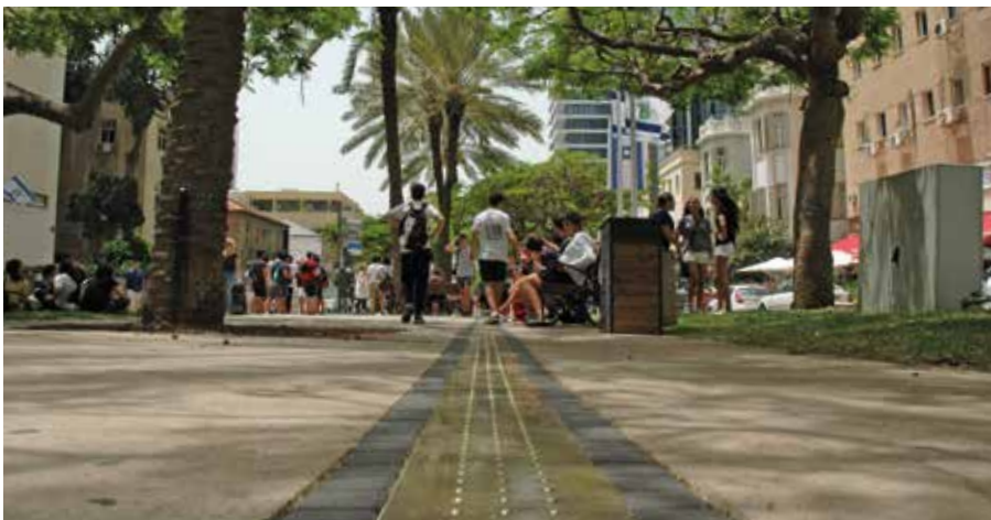
Auf dem Rothschild-Boulevard in Tel Aviv hat sich der Wanderweg umgehend zum Publikumsmagneten entwickelt

Am Informationscenter auf dem Rothschild-Boulevard gibt es Erklärhefte zum Wanderweg in acht Sprachen, darunter auch auf Deutsch. „Diese Stadt war ein Experiment. Sie war eines der wichtigsten Experimente in der 2.000-jährigen Geschichte der jüdischen Diaspora“, sagt Ron Huldai, Bürgermeister von Tel Aviv. Die Stadt sei der erste Schritt einer Erneuerung der Souveränität des jüdischen Volkes in seiner Heimat gewesen. |